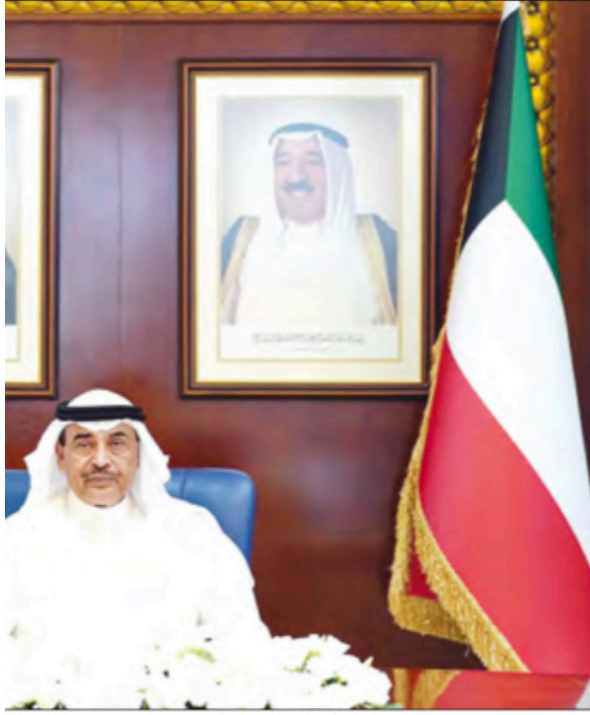
صباح الخالد مترئساً لاجتماع مجلس الوزراء أمس

تكليف «الاتصالات» بقرار السياسات الخاصة بالحوسبة السحابية للاستفادة من الخدمات التكنولوجية