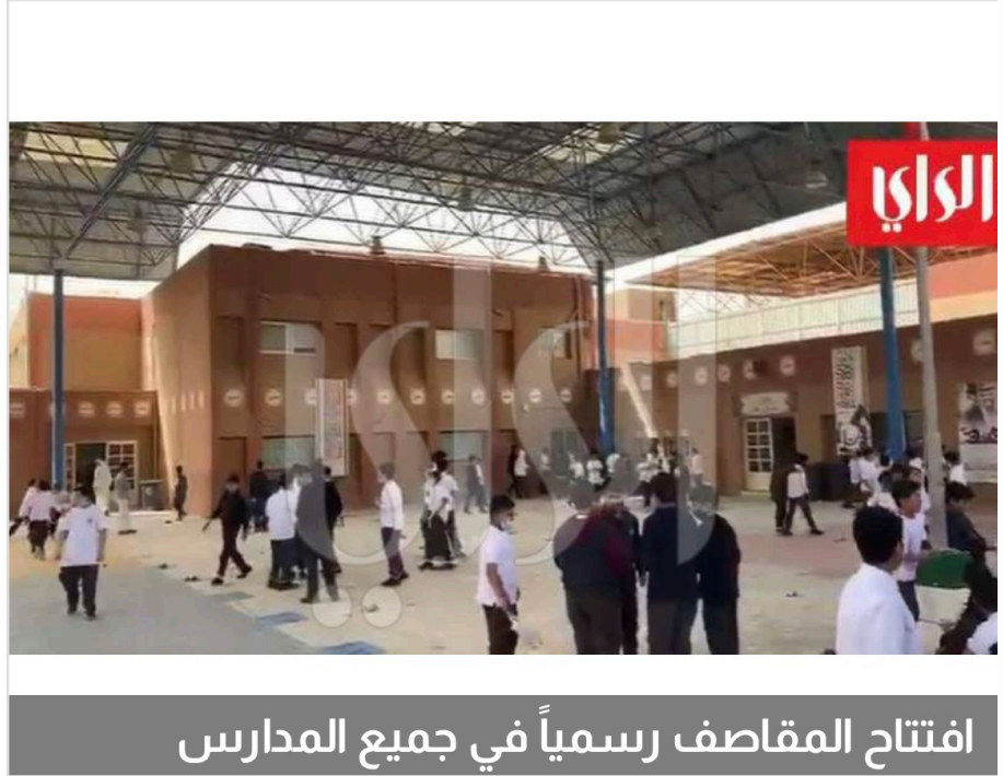
افتتاح المقاصف رسمياً في جميع المدارس

افتتحت جميع المدارس الحكومية مقاصفها المدرسية بشكل رسمي في المراحل التعليمية كافة عدا رياض الأطفال، فيما اعتمد الوكيل المساعد للتنمية التربوية والأنشطة فيصل المقصيد الشركات والمطاعم المؤهلة لتوريد المنتجات الغذائية إليها للعام الدراسي 2021-2022.