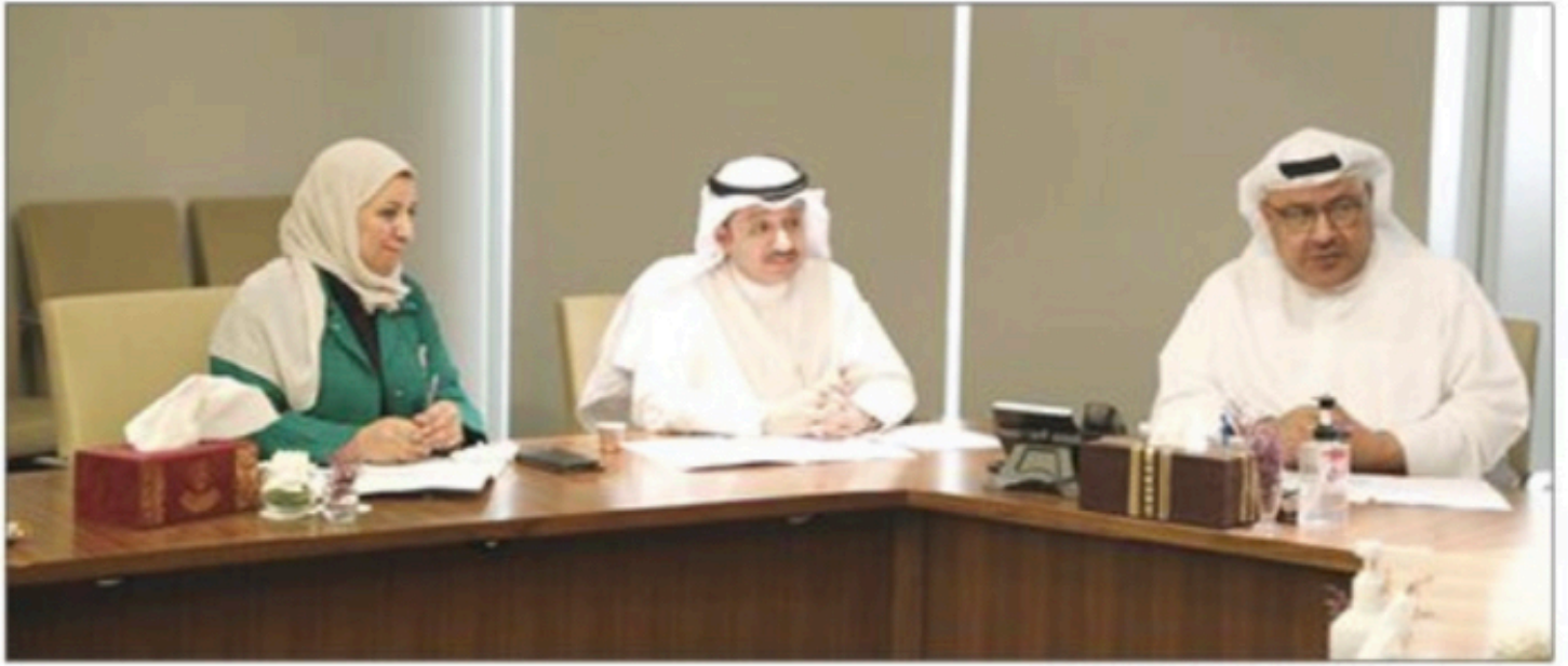
الحمدة والحويلة والسلفطان خلال الاجتماع

المدرسية وكمياتها، وجودة المقصف المدرسي، والشروط الصحية الواجب توفرها في المقصف ومخزن توفير الأغذية. وتم توضيح الضبطية القضائية التي تقوم بها الهيئة العامة للغذاء والتغذية. وكما تم الاتفاق إجراء استمارة التقييم الذاتي للمدارس الخاصة بالإضافة إلى عقد دورات تدريبية للمعنيين في أنشطة إدارة التعليم الخاص.